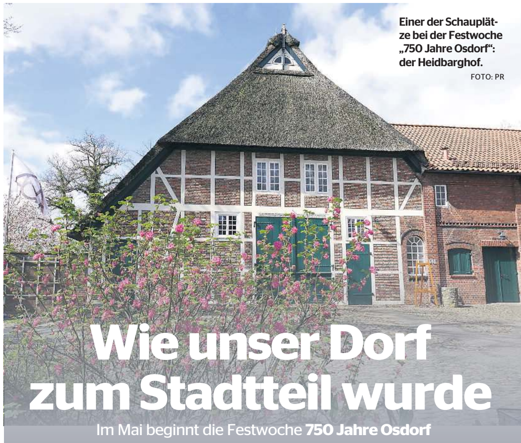
Einer der Schauplätze bei der Festwoche „750 Jahre Osdorf“: der Heidbarghof.

Porträt: Birgit Müller ist Chefredakteurin des Straßenmagazins „Hin&Kunzt“, das in diesem Jahr 25 Jahre alt wird 16