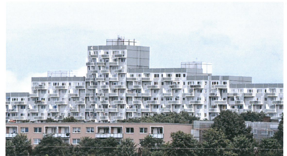
Das ist der bekannte Blick auf die Hochhäuser am Osdorfer Born

Neuer Blick auf ein Quartier im Abseits: "Stadtteiltourismus Osdorfer Born" lädt am Dienstag zum Rollski-Biathlon und Abseil-Übungen.